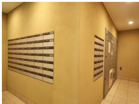
集合ポスト・宅配BOX