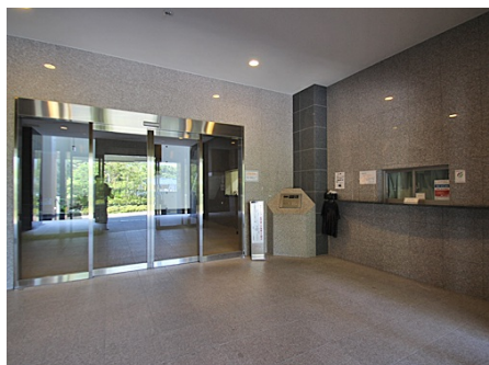
管理室・オートロック