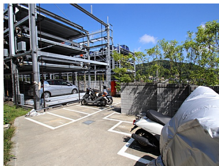
バイク置き場と駐車場