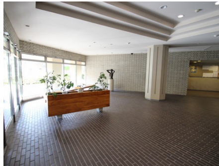
エントランス内部