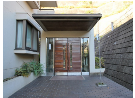
サブエントランス