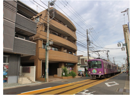
目の前を江ノ電が通ります。