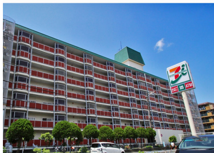
外観と周辺のお店