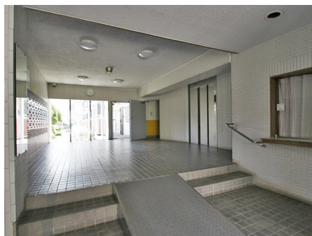
エントランス内側