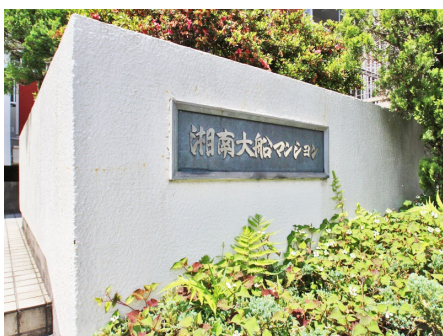
マンションの入口