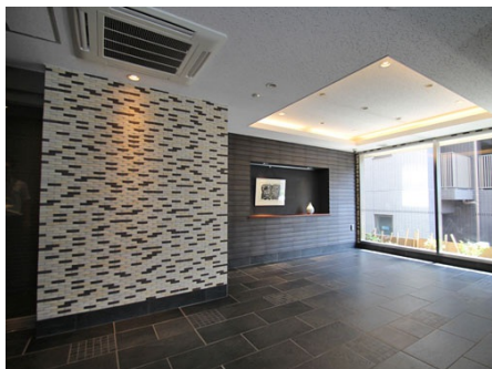
エントランス内部