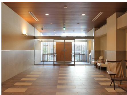
エントランス内部