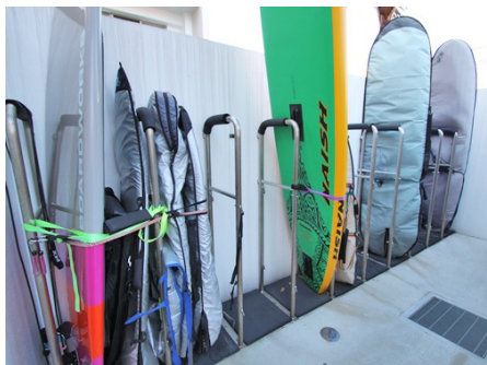
サーフボード置場