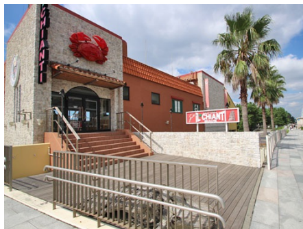
目の前のイルキャンティ・ビーチ