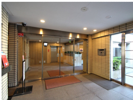
オートロック付き