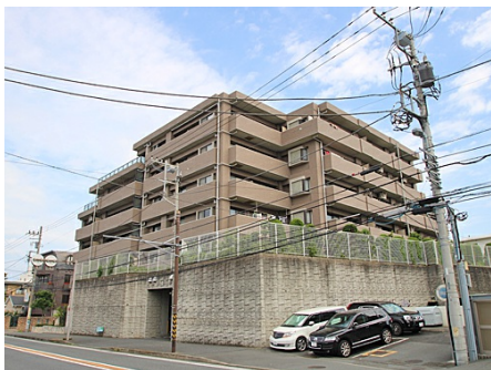
西側から見た外観