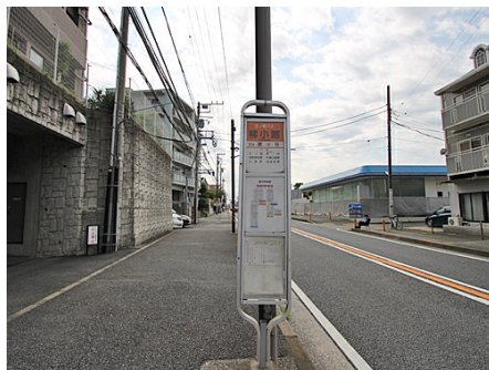
柳小路バス停が目の前