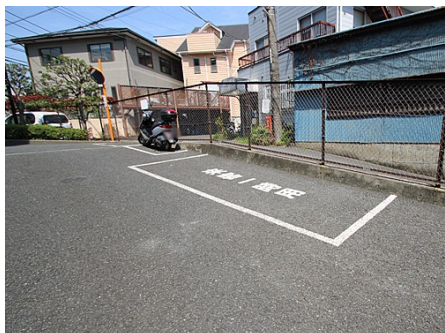
来客用駐車場とバイク置場