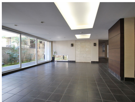
開放感のあるロビー