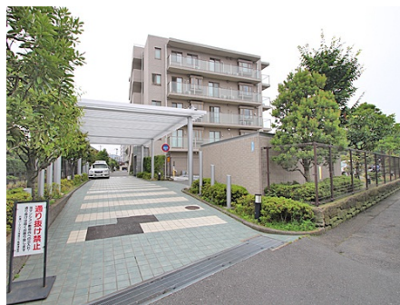
マンション入り口