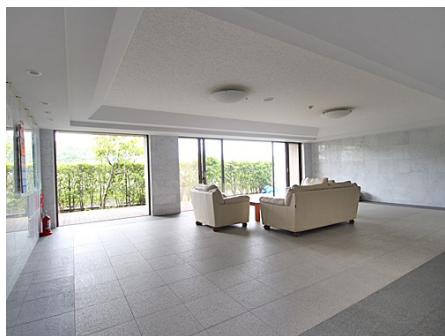
明るく開放的なロビー