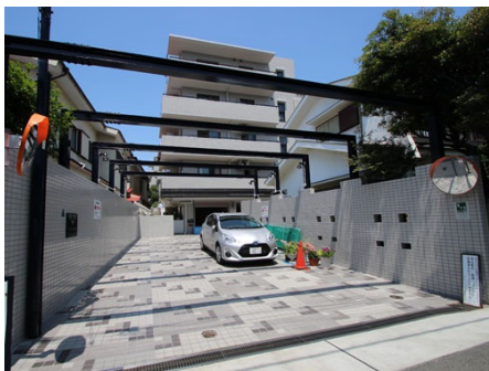
マンションへの入口