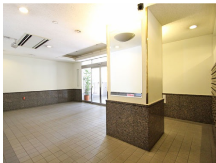
エントランス内部