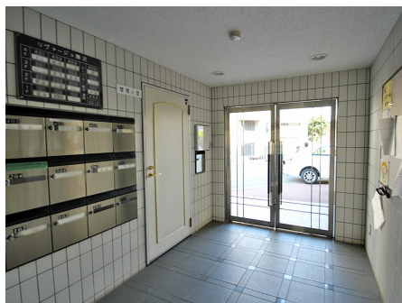
管理人室・集合ポスト