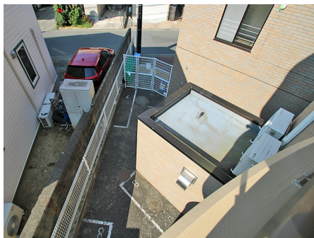
上から見たバイク置場