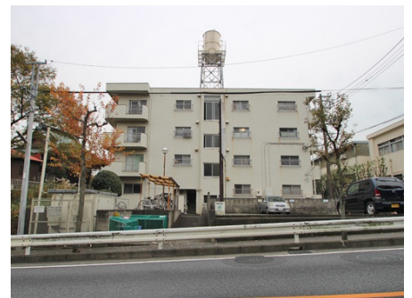
道路側から見た外観