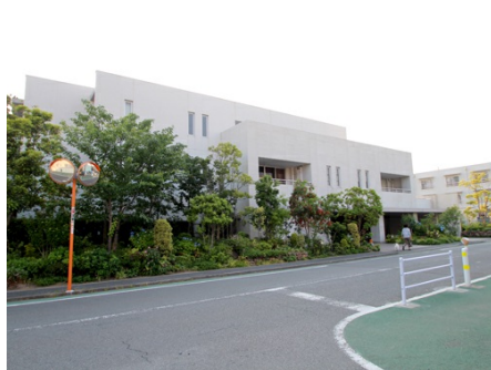
道路より見た外観