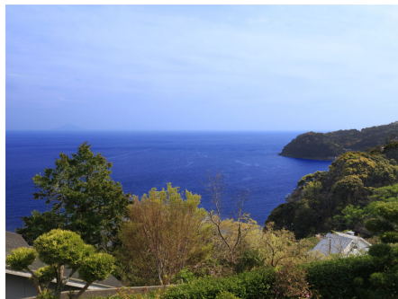
別荘地内より眺望