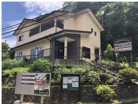
カスタマーセンター

リゾート地としての長い歴史を持つ、伊豆半島。大自然と穏やかな気候、そして何よりも数多くの良質の温泉が人々を魅了してきました。その伊豆の最高峰、天城山と遠笠山の山裾に位置する熟成された伊豆大川汐見崎。眼下には、広大な相模灘が広がり、伊豆大島をはじめとする島々が彩りを添えています。四季折々の景観と、味覚の変化を楽しみながら、充実したリゾートライフをお過ごし頂けます。