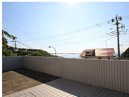
エントランスからは海を望む