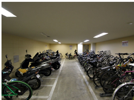
バイク置場・駐輪場