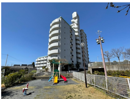
隣接する公園と外観