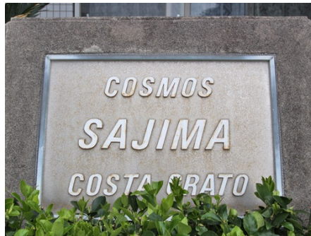
コスモ佐島コスタ・グラート