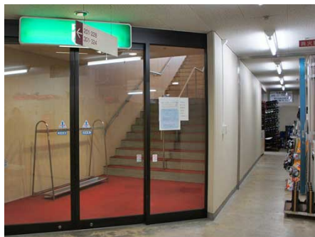
隣接したスキー場へのアプローチ