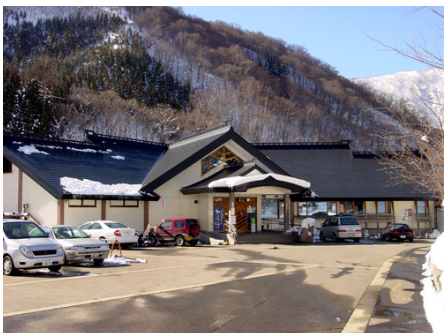
車で約15分の温泉施設「宿場の湯」