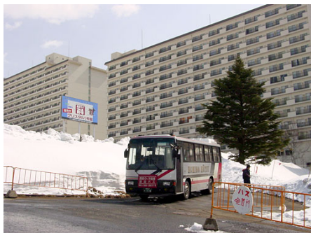
苗場スキー場シャトルバス運行