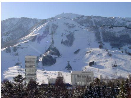
シャトルバスが出る苗場スキー場