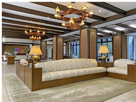
落ち着いたあるロビー