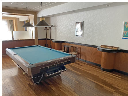
ビリヤード台があります