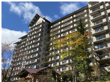
ソネット草津 外観