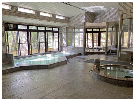
温泉大浴場（かけ流し）