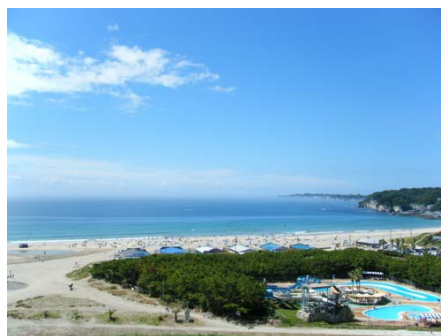
御宿中央海水浴場(徒歩約6分)