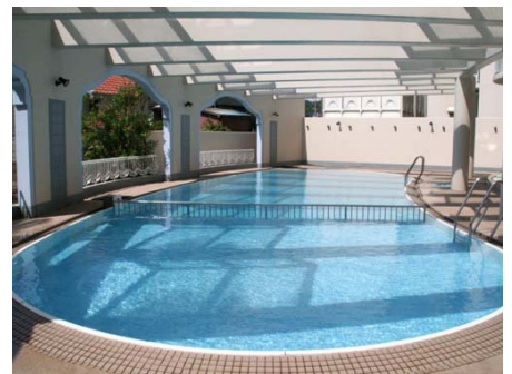
屋外プール(夏季営業)