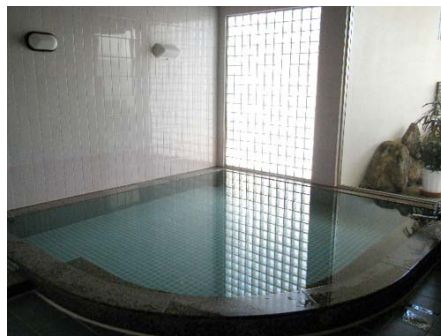
大浴場(サウナ付き)