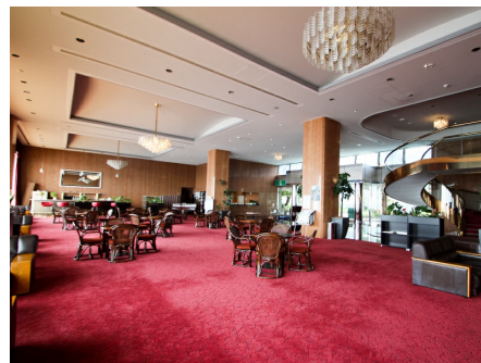
海一望のラウンジ