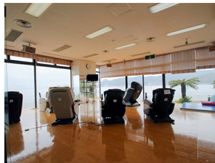
リラックスルーム