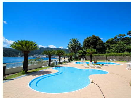
海横の屋外プール