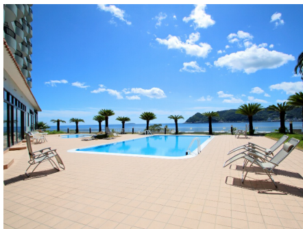
海風を感じる屋外プール