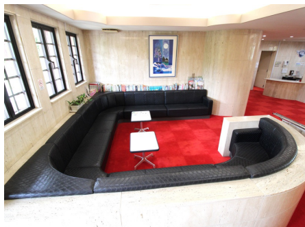
エントランスラウンジ