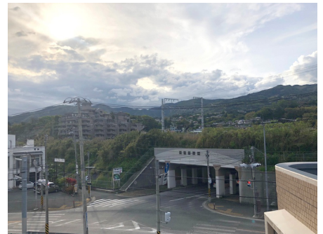
上層階からの眺望北西側