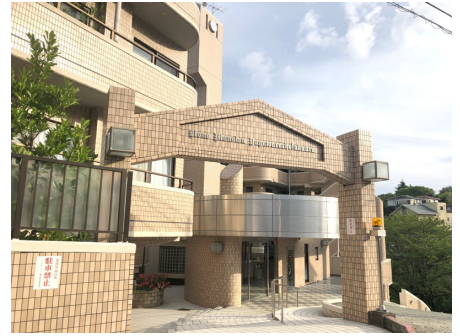
マンション入口(4階)