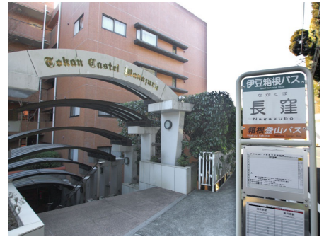
マンション入口(目の前にはバス停)