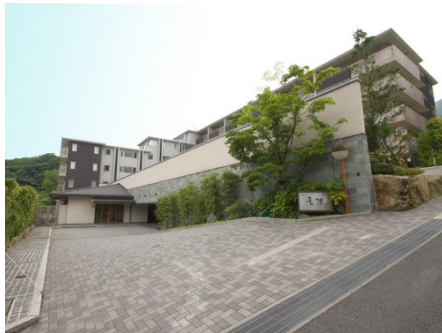
和のテイストが素敵な外観