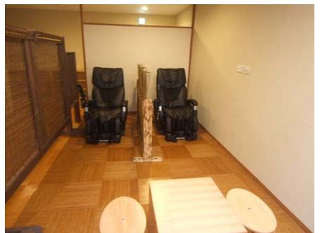
マッサージ機も癒やしのアイテム