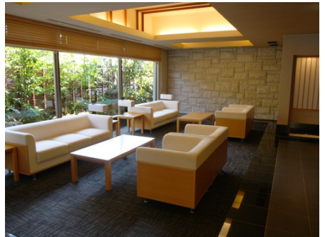
間接照明が優しいフロントロビー