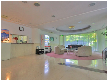
エントランスロビー