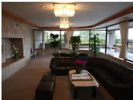
ゆっくりとくつろげるロビー