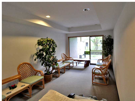
湯上がりラウンジ