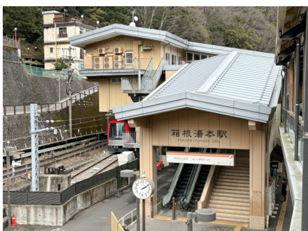
箱根湯本駅まで徒歩で約5分