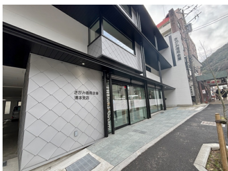
さがみ信用金庫湯本支店まで徒歩圏内