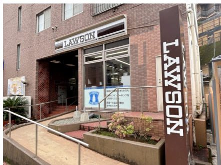
テナント1階にコンビニがあります。