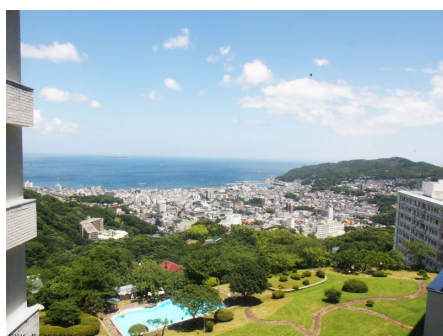
マンションからの眺め