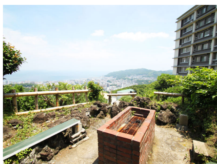
海を眺めながらのBBQコーナー