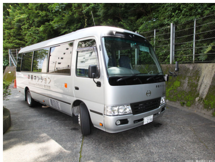
送迎マイクロバス (マンション～伊東駅)