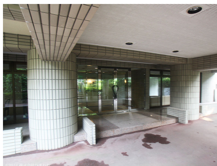
セキュリティ万全 オートロック