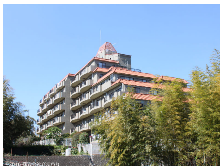
青空に映えるニューステージ