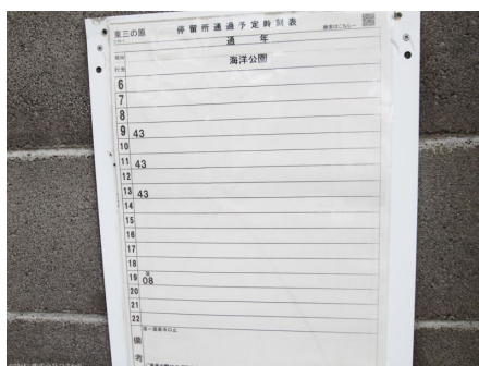
伊東駅から4便 海洋公園行