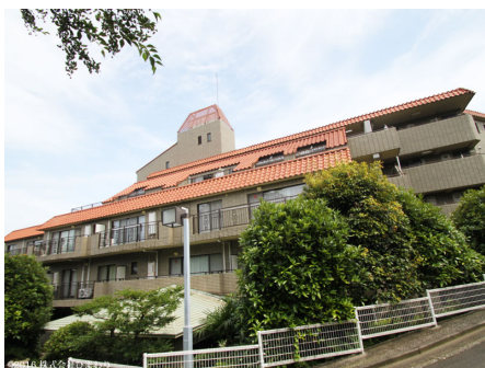
リゾートマンションの風格