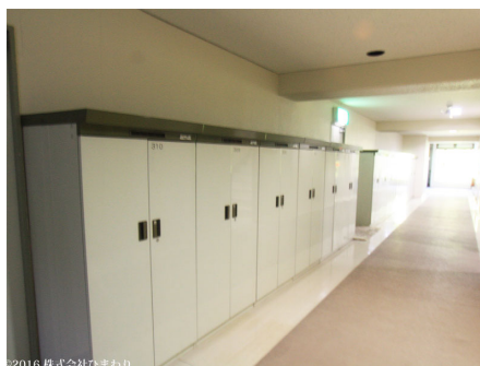
各部屋 ロッカーあり