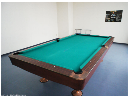
ビリヤードコーナー