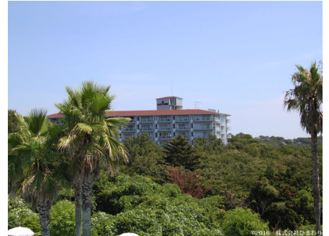
緑に囲まれたスカイリゾート