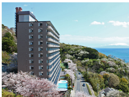
国道から見る外観