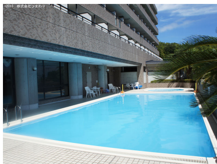
クアプール(夏季のみ)