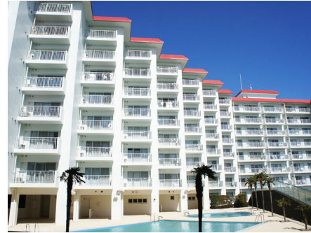
プールから見るシーアイヴィラ