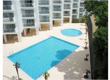
リゾート感ある屋外プール