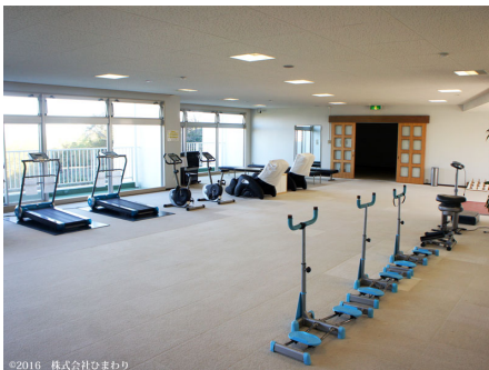
海を眺めながらスポーツルーム