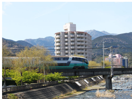
白田川と電車とロワジール熱川南