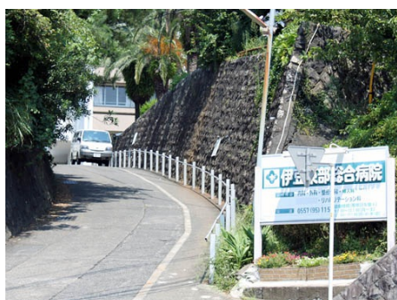
道路向かいの伊豆東部総合病院(徒歩2分)