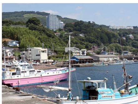
港からフレールを望む