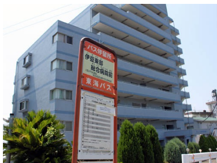
バス停とフレール伊豆稲取(バス停徒歩1分)