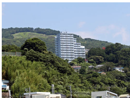
役場からフレールを望む