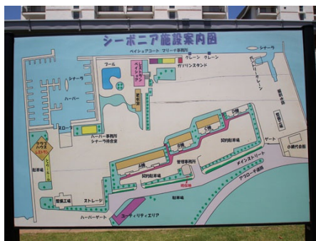
シーボニア施設案内図