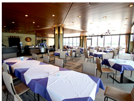
レストラン（マリーナ内）