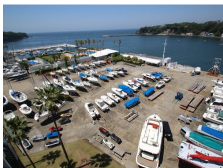
シーボニアマリーナ