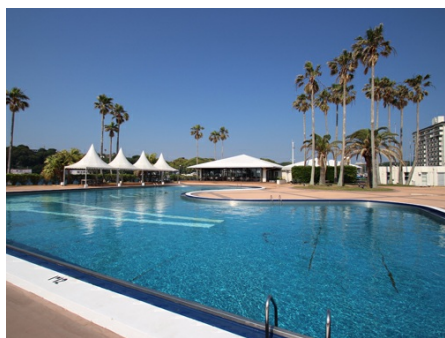
プール（マリーナ内）