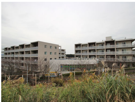
徒歩2分の京急三崎口駅