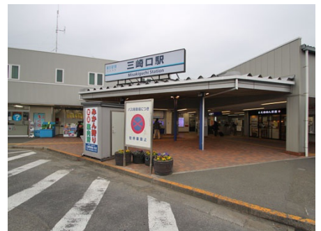
徒歩2分の京急三崎口駅