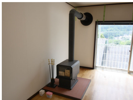
山小屋風のスタンスでペーチカ付