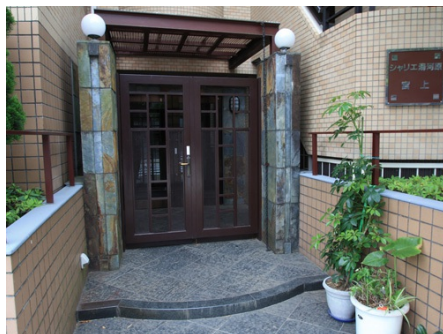
マンション入り口