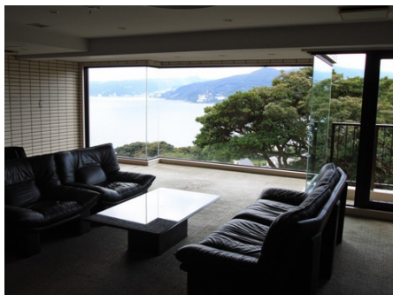
海が見えるロビー