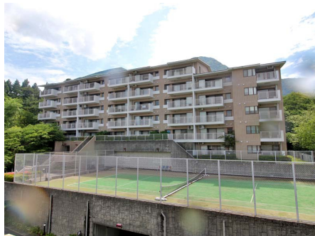
マンション外観（D棟）