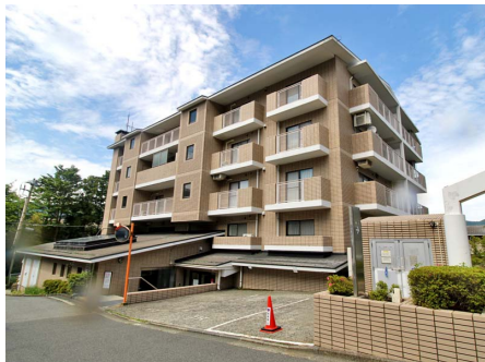
フロント・大浴場・プールのあるC棟