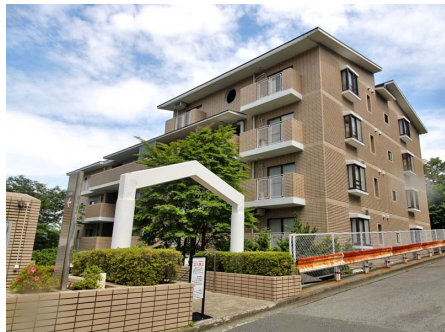
マンション外観（B棟）